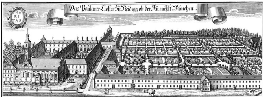
Ἡ μονὴ τῶν Παυλανῶν, 1700

Ἡ διαταγὴ ἐκ μέρους τοῦ πρίγκηπος ξάφνιασε τοὺς μοναχοὺς καὶ τοὺς βρῆκε ἀπροετοίμαστους. Τὸ τελευταῖο ἔτος εἶχε δεῖ δραματικὲς ἀλλαγές στὸ μεσαίου μεγέθους κράτος. Ὁ πρίγκηπας, βυθισμένος στὰ χρέη, βρισκόνταν σὲ μεγάλη δυσκολία ἀπὸ τὴν γαλλικὴ κατοχὴ. Τὸ κράτος ἦταν χρεωκοπημένο καὶ ζήτησε ἀπὸ τοὺς μοναχοὺς 30.000 φλωρίνια νὰ πληρωθοῦν ἀμέσως. Οἱ μοναχοί, πιεσμένοι ἀπὸ πολλὲς πλευρές, ἀρνήθηκαν· ὅλες οἱ διαμαρτυρίες τους κατέληξαν στὸ κενό. Ἡ μονὴ διαλύθηκε, ἡ κινητὴ καὶ ἀκίνητη περιουσία της δημεύτηκε. Ἐπτὰ χρόνια μετὰ, ἕνας ζυθοποιὸς σφετερίσθηκε τὸ ζυθοποιεῖο τῶν μοναχῶν, ποὺ ἦταν ὁ πιὸ παραγωγικὸς κλάδος τῆς παλαιᾶς λειτουργίας τῆς μονῆς.