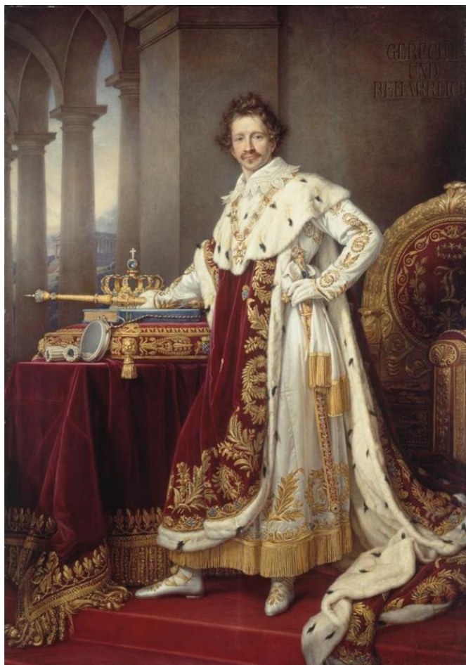
Ὁ Λουδοβίκος Α΄ (1786–1868), βασιλεὺς τοῦ βασιλείου τῆς Βαυαρίας (1825–1848) ὁ ὁποῖος ἐπέστρεψε τὸ ἥμισυ τῆς διαρπαγείσης μοναστηριακῆς περιουσίας

ξενικὴ ἐπέμβαση στὴν μακραίωνη παράδοση τοῦ τόπου, φορεῖς τῆς ὁποίας ἐπὶ σειρὰ αἰῶνων ὑπῆρξαν οἱ μονές 14 .