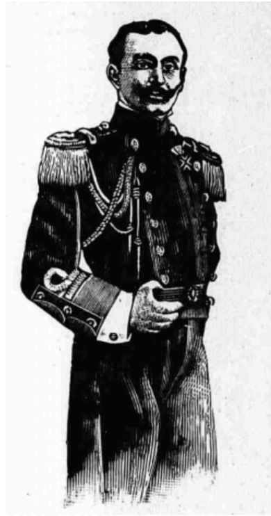
Περικλῆς Ἀργυρόπουλος (1871–1955), Υποναύαρχος, πολιτικός καὶ διπλωμάτης

Μία δεύτερη παρατήρηση ἔχει νὰ κάνει μὲ τὸν ἀνομολόγητο σκοπὸ τῆς ἀπαλλοτριώσεως τῶν ἀγιορειτικῶν μετοχίων. Ὅπως προκύπτει ἀπὸ τὶς ἀρχειακὲς πηγές, ὁ τότε Γενικὸς Διοικητὴς Θεσσαλονίκης Περικλῆς Ἀργυρόπουλος, καὶ μετέπειτα τὸ 1926 Ὑπουργὸς Ἐξωτερικῶν, καὶ τὸ 1928 Ὑπουργὸς Ἐσωτερικῶν, κατὰ τὸν κρίσιμο δηλαδὴ χρόνον τῶν ἀποφάσεων γιὰ τὶς ἀπαλλοτριώσεις, σὲ ἐπιστολὴ του πρὸς τὸ ΥΠΕΞ τῆς 17 ης Μαΐου 1918, ἀνέφερε: «τὸ πρωτεῦον δι' ἡμᾶς ζήτημα εἶναι τὸ τοῦ ἐλέγχου τῆς οἰκονομικῆς διαχειρίσεως τῶν Μονῶν... ἄλλωστε αἱ περιουσίαι τῶν Μετοχίων τῶν Μονῶν εὐρίσκονται ἐντὸς τῶν ὁρίων τοῦ Ἑλληνικοῦ Κράτους, τοῦθ' ὅπερ θὰ παράσχη εἰς τὴν Κυβέρνησιν τὸ μέσον τῆς ἐπεμβάσεως καὶ τῆς ἐπιβολῆς τοῦ ἐλέγχου ἐπὶ τῆς ὅλης οἰκονομικῆς διαχειρίσεως τῶν Μονῶν» 22 . Μὲ παρόμοιο τρόπο ἐνήργησαν καὶ οἱ Νεότουρκοι. Αὐτὴ ἡ