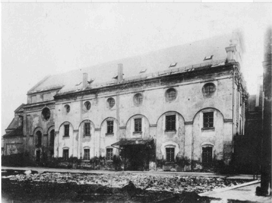
Ἡ πρώην ἐκκλησία τῆς μονῆς τῶν Παυλανῶν, 1895

Ἐπάνω φαίνεται ἡ εἰκόνα τῆς μονῆς τοῦ 1700 ἐνῶ στὰ τέλη τοῦ 19 ου αἰῶνος ἡ κατάσταση εἶναι πλέον τελείως διαφορετική. Σῶζεται ἡ φωτογραφία τῆς πρώην ἐκκλησίας ποῦ ἀποτυπώνει τὴν τότε κατάσταση, τοῦ 1895: